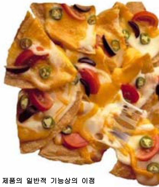
가공 치즈 및 스프레드에 사용되는 유청 제품의 일반적 기능상의 이점

유청 제품은 혼합 타입에 따라 혼합물과 최종 제품에 불투명성, 미백성, 혹은 우유 같은 느낌을 더해 준다.